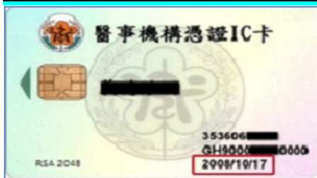
醫事機構憑證 IC 卡