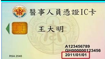
醫事人員憑證 IC 卡